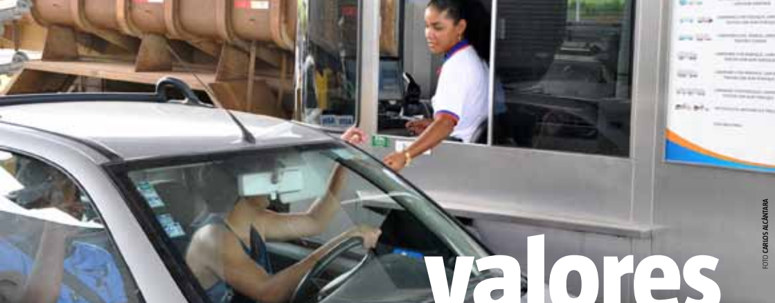
Tabela de tarifas das praças de pedágio: P1 (Simões Filho) e P2 (Amélia Rodrigues)