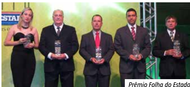
Prêmio Folha do Estado

As rodovias administradas pela VIABAHIA também receberam um excelente reconhecimento em 2012. Após serem avaliadas como “BOAS” em 2011 e 2012 pela pesquisa anual da CNT (Confederação Nacional do Transporte), que avalia as condições das rodovias de todo o Brasil, a VIABAHIA tem orgulho de possuir este ano o único trecho considerado “ÓTIMO” em todo o estado da Bahia, localizado na BR-324! É a VIABAHIA ajudando a trazer ainda mais melhorias para as rodovias baianas.