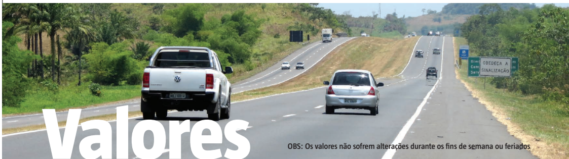
Tabela de tarifas das praças de pedágio BR-324 - rodovia Eng.º Vasco Filho