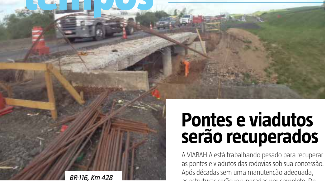
BR-116, Km 428