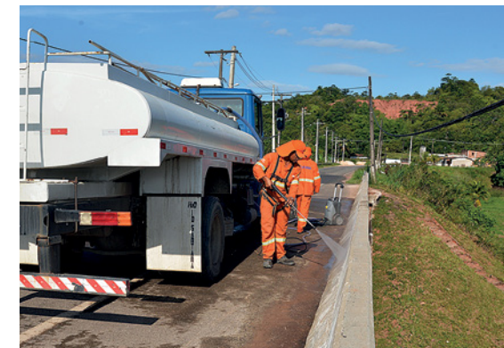
Trabalhos de limpeza e desobstrução de drenagens em pontes e viadutos