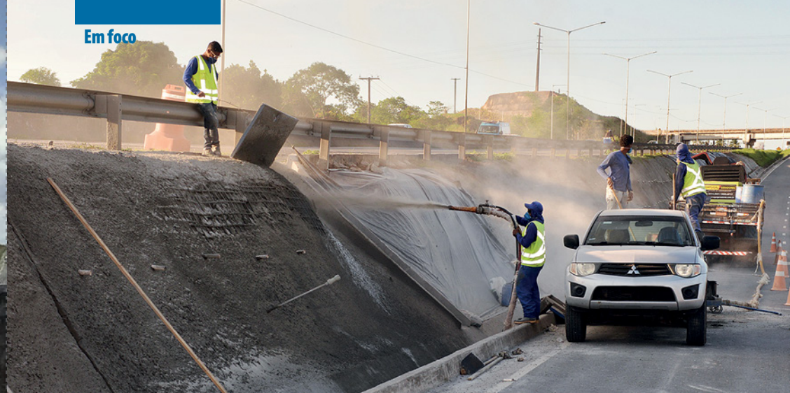
Diversas frentes de trabalho atuam nas rodovias BR-116, BR-324 e nas BAs 526 e 528

reparos de pontes e viadutos e recomposição de terraplenos, com o objetivo de oferecer rodovias cada vez mais seguras para os usuários, além de mais de 400 empregos diretos para trabalhadores envolvidos nas intervenções. Em 2021 prosseguiremos com os trabalhos, com investimentos importantes