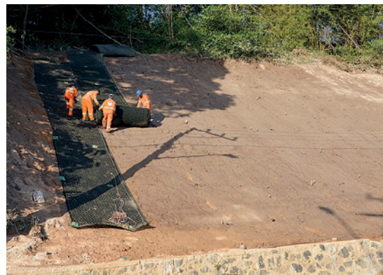
Força de trabalho atua na recuperação e estabilização de taludes

de trabalho em diversos pontos da nossa área de atuação, com recuperação de pavimento, sinalização, bueiros,