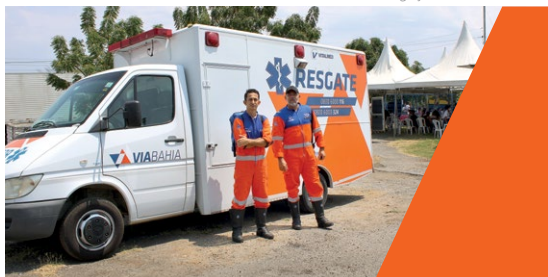
Equipe de resgatistas da VIABAHIA prestaram apoio à ação

Para além da saúde física, o professor chama a atenção para a importância de promover atendimentos que incluam a saúde mental e emocional desses motoristas. Por isso, durante o “Saúde na BR”, eles também