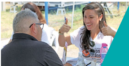
Caminhoneiros receberam orientação nutricional