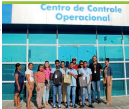
Estudantes visitaram o Centro de Controle Operacional da VIABAHIA