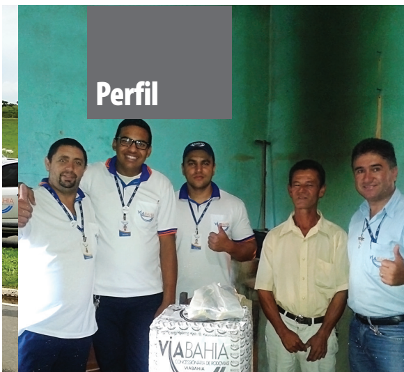
Equipes da VIABAHIA formam mutirões para ajudar o próximo